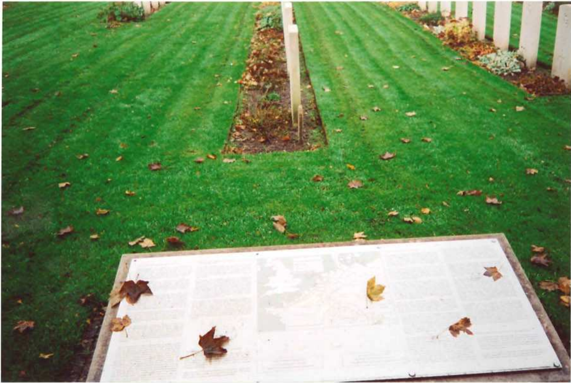
Foto's van de oorlogsgraven in Vlissingen.